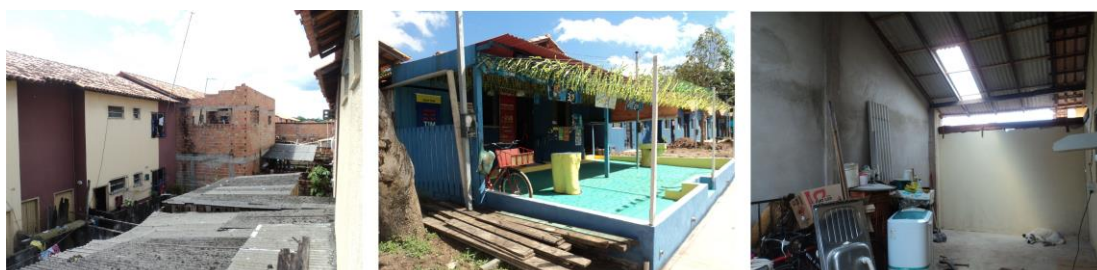
Figura 5 – Habitações modificadas

Mostra-se na Figura 5, a construção de laje em área livre, ampliação da frente de uma unidade térrea, para construção de um bar e ampliação da casa em área de quintal.