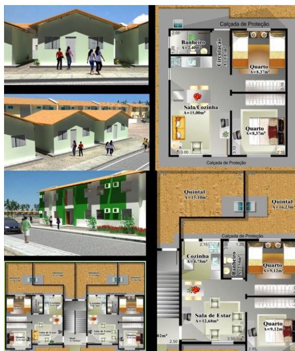
Figura 1 – Unidades habitacionais do Projeto Taboquinha