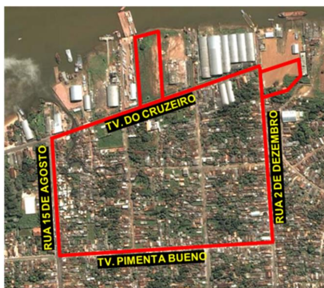
Figura 2 – Área da poligonal do Projeto Taboquinha