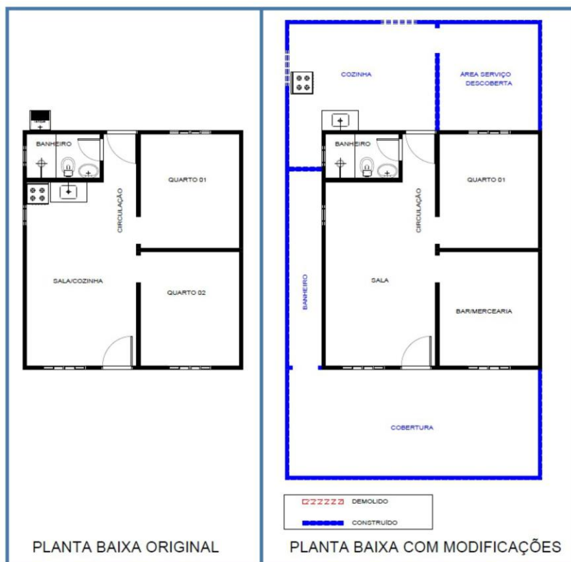
Figura 6 – Planta baixa de uma casa modificada do Projeto Taboquinha